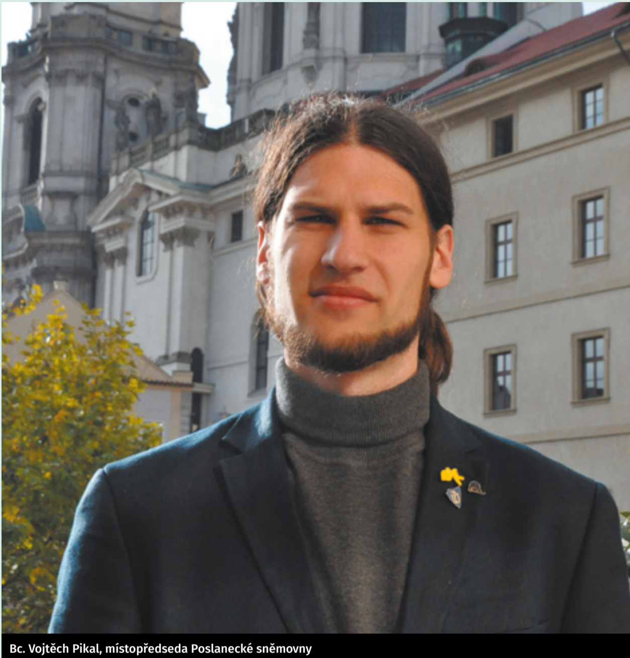
Bc. Vojtěch Píkal, místopředseda Poslanecké sněmovny

Nemám auto ani řidičák a hodlám to tak nechat. Vyrostl jsem v rodině bez auta a nikdy jsem nepocítil, že by chybělo. Člověk potřebuje auto, když se třeba stěhuje, a to je většinou jednorázová záležitost. Začal jsem víc využívat taxíky ve smyslu, že někde dojezu a rozhoduji se mezi tím, zda budu na místě čekat půl hodiny na spoj nebo se taxíkem přesunu hned. V tom penzu času, který nemám, se to vyplatí. Taxík je pro mne ekonomičtější než auto vlastnit. Ostatně my Piráti, podporujeme sdílení dopravních prostředků