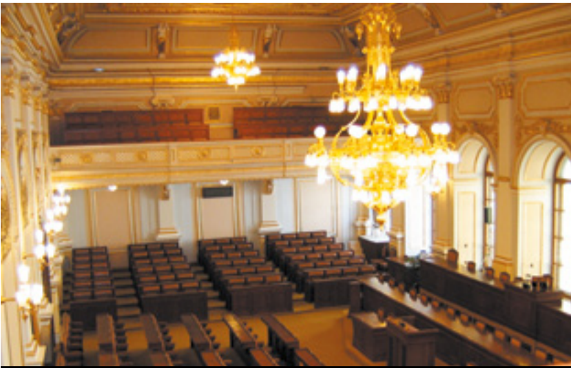
Poslanecká sněmovna Parlamentu České republiky