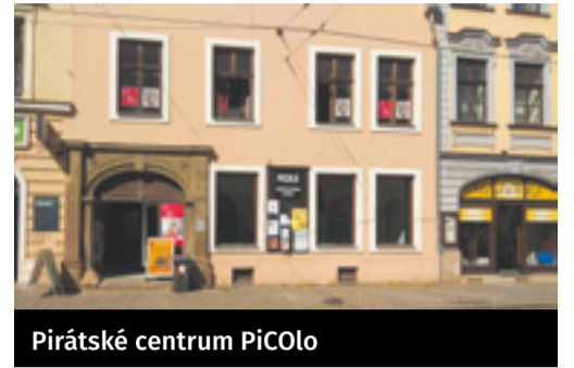
Pirátské centrum PiCOlo