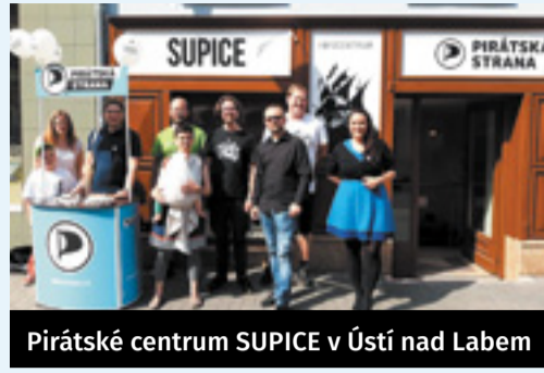
Pirátské centrum SUPICE v Ústí nad Labem