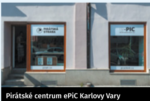
Pirátské centrum ePiC Karlovy Vary