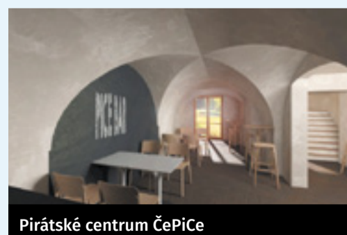
Pirátské centrum ČePiCe

Plzeňské Pirátské centrum Plzeň, u Zvonu 4/9 Regionální poslanecká kancelář Lukáše Bartoně Plzeň, u Zvonu 4/9 Pondělí: 14:00 – 17:00 Úterý: 14:00 – 17:00 Středa – pátek: 14:00 – 17:00