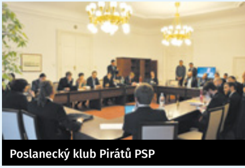
Poslanecký klub Pirátů PSP