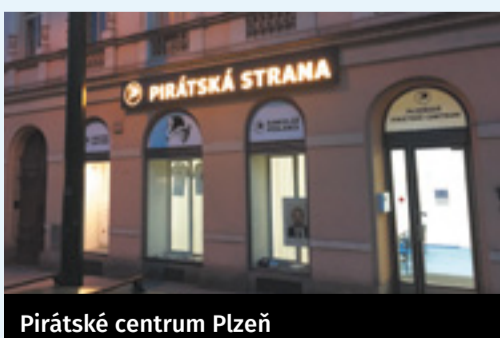
Pirátské centrum Plzeň