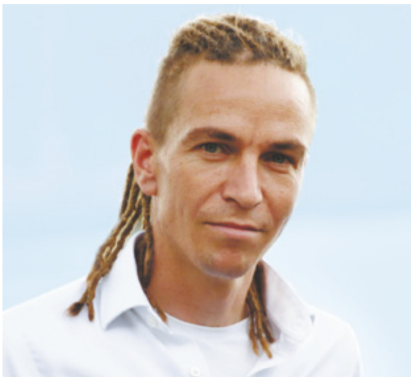
PhDr. Ivan Bartoš, Ph.D., předseda Pirátské strany