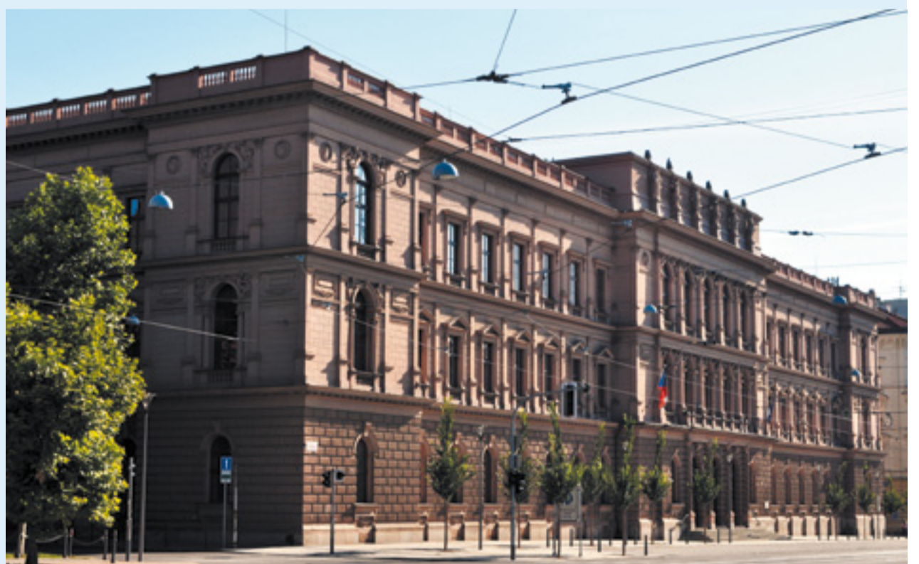
Piráti podali žalobu k Ústavnímu soudu na zákon o plošném šmírování občanů.