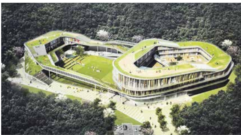
Moderní vzdělávací areály lze skloubit s lesy a přírodou

Profesionálové počítali, kolik nás bude, odhadli, kdy se školy přeplní a odkdy se budou vyprazdňovat. Konstatovali, že čtvrtinu našich obyvatel budou tvořit senioři, ale také to, že výrazně naroste počet adolescentů. A to je kategorie stejně neurčitá jako pojem senioři. Podle učebnic je adolescentům 15 – 20 let, když ale použijeme jiné měřítko, jímž je osamostatnění se od původní rodiny, můžeme klidně přidat 10 let navíc. Zkrátka adolescent je člověk skoro dospělý, velmi často chytrý a šikovný, ovšem také člověk, který se chce spíše bavit než usadit a o založení rodiny se baví, jen když má citlivou náladu.