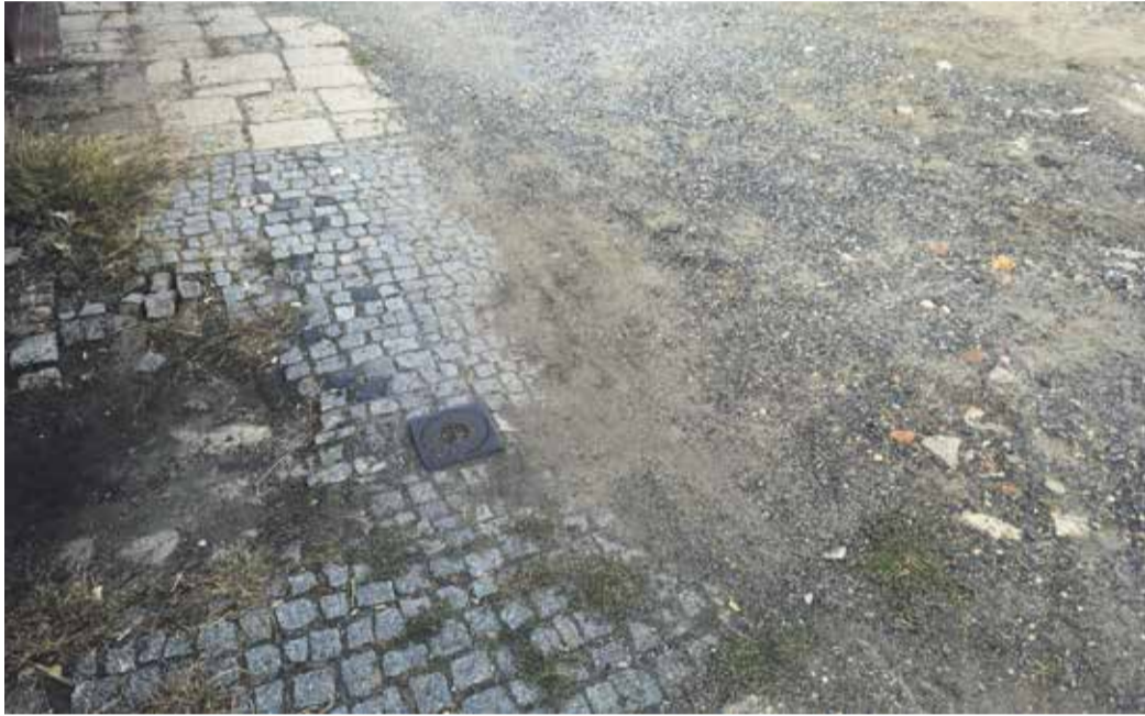
Rozbité silnice. Nejde je donekonečna záplatovat, musí se opravit pořádně a pak dlouhodobě udržovat, což by mohla dělat městská servisní organizace BBM.

levněji a zároveň nejkvalitněji. Do konce roku 2022 by tak Brandýs i Boleslav měly renovované všechny zanedbané městské ulice, v jednotném stylu a v úpravě pro zachytávání dešťové vody i včetně výsadby městské zeleně pro snížení vedra ve městě. Financování by proběhlo formou bankovní půjčky, kterou by město splácelo z peněz, které dnes pravidelně beztak alokuje na opravy ulic. Jenom bychom využili příležitosti na finančním trhu, kdy půjčky (zejména pro města) jsou za velmi výhodných podmínek 1-2% úročení a zafixovali dnes rostoucí ceny stavebních prací. O další běžné opravy by se starala městská servisní organizace BBM.