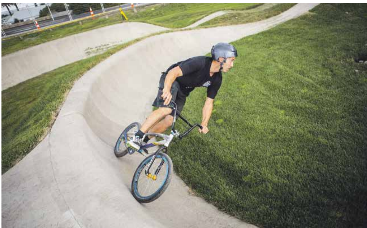
Zpevněný povrch pumptracku umožní větší kreativitu, ale nesedne každému. Variantou jsou i variabilní povrchy umožňující změnu profilu dráhy. Co zvolit? I o tom by měla rozhodovat Rada Mladých.