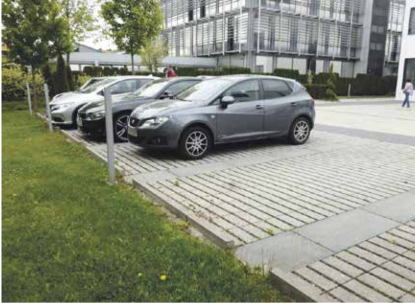
Obr. 1 – Odvodnění parkoviště přerušovaným obrubníkem, Mnichov – Riem

Jsme jedno z nejteplejších měst v Česku. A řadíme se mezi nejvyprahlejší. Buďto se smíříme s odstávkami vody, poklesem vody ve studních a vyprahlými parky či zahradami, nebo s vodou začneme hospodařit. Jak?