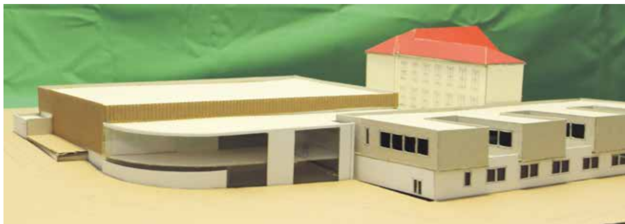
Hmotový model haly a budovy školy není tak hezký, jako obrázek z projektu. Pomohl nám ale ověřit, jak hala zapadne ke škole i do krajiny. Jsme jediní, kdo to takhle promýšlel.