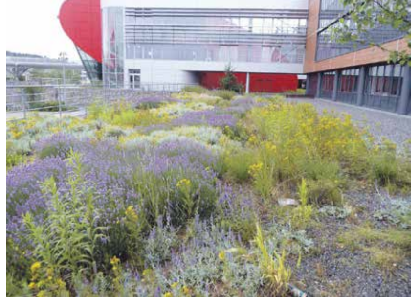
Obr. 2 – Plošné vsakování srážkových vod přes šterkovou vrstvu, kampus MU Brno

Hospodaření s dešťovou vodou zahrnuje koncepční kroky, které v ideálním případě vyplývají ze Studie odtokových poměrů (SOP) zastavěného území. SOP je vlastně matematickým modelem, který pracuje s daty o pohybu vody ve městě, odkud voda přichází, kudy proudí a odchází. Výsledkem této studie je nejen návrh řešení plynulého odtoku a žádoucího zadržetí srážkové vody v půdě, ale také systém protipovodňových opatření. Díky aplikaci výstupů ze SOP je možné zodpovědně plánovat výstavbu a rekonstrukce v území s ohledem na riziko záplav i na odpadní hospodářství obce při minimalizaci podílu dešťové vody svedené do kanalizace. Voda v krajině má svou nezastupitelnou funkci, také má svou paměť a je moudré ji i v městském prostředí respektovat. Praxe ukazuje, že studie zpracovávající jednotlivé stavby jsou, bohužel,