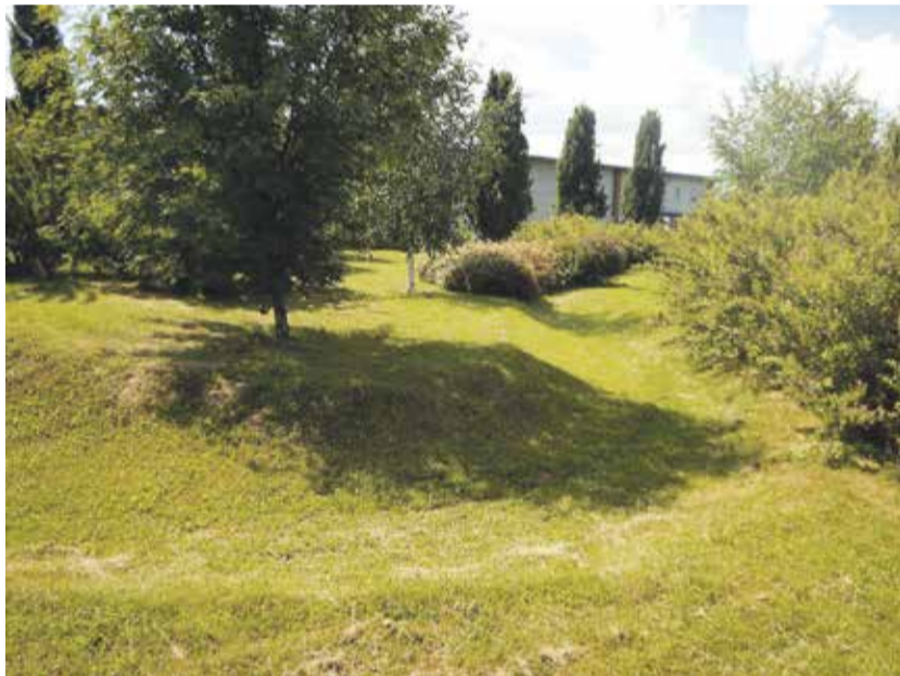
Obr. 3 – Vsakovací průleh Praha - Čestlice

přes střednědobá opatření jakými jsou instalace pítek a mlžitek ve veřejném prostoru až po opatření koncepční. Tedy dlouhodobá opatření, mezi která patří například podpora realizací zelených střech, druhová rozmanitost veřejné zeleně – od půdokryvných rostlin, přes luční společenství, keře až po stromy, ochrana a péče o mokřady,