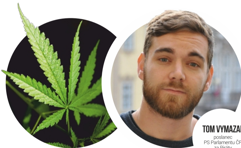
TOM VYMAZAL poslanec PS Parlamentu ČR za Piráty

Doplatek na bydlení je jednou z dávek pomoci v hmotné nouzi. Nárok na něj mají lidé, kterým i po pobírání příspěvku na bydlení a příspěvku na živobytí nezbude při zaplacení nákladů na bydlení alespoň částka na živobytí, případně i osoby, které na příspěvek na živobytí a příspěvek na bydlení nemají nárok.