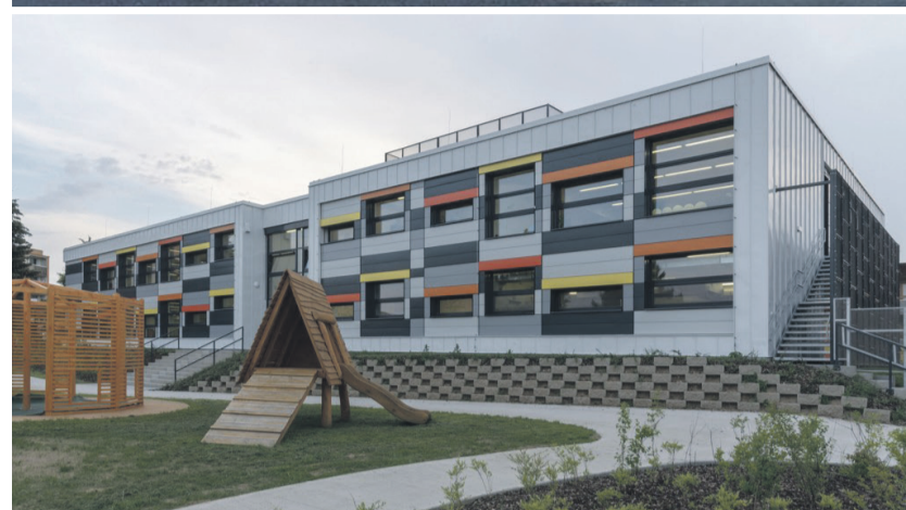
MŠ Úsměv Benešov: stará a nová tvář