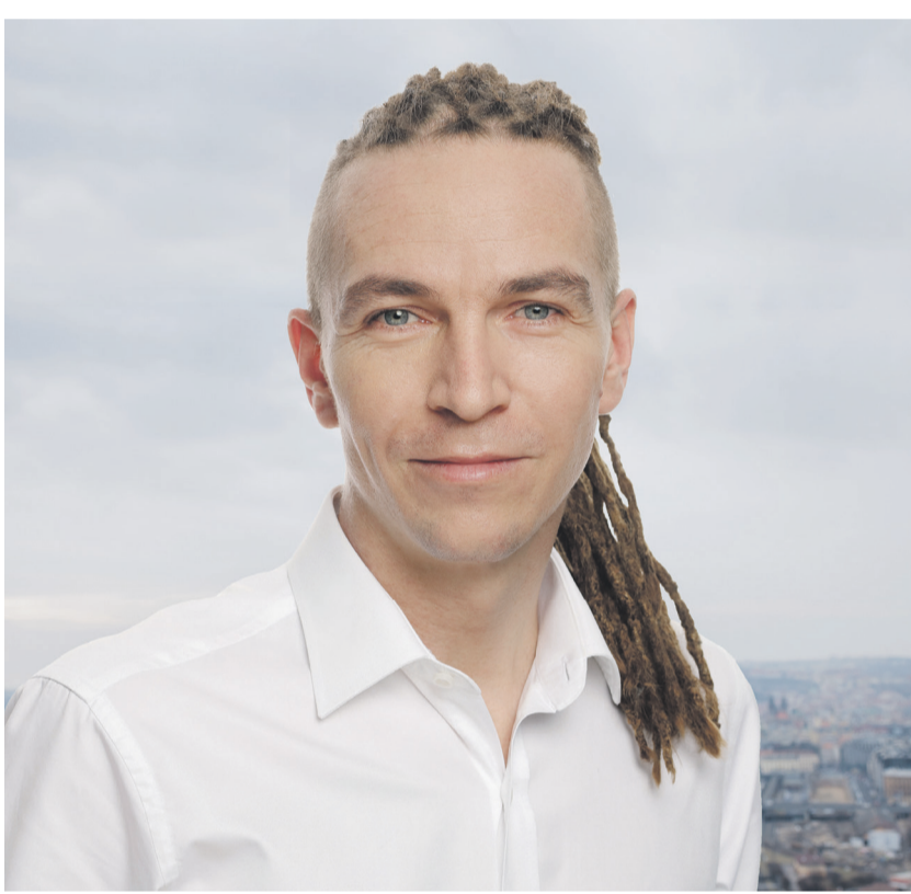
PhDr. Ivan Bartoš, Ph.D., předseda České pirátské strany

Mnozí z vás si pamatují, jak jsme před pěti lety s Piráty skončili těsně před branami Evropského parlamentu. Od té doby jsme ušli obrovský kus cesty. Stali jsme se stranou s celostátní působností. Máme zastoupení ve všech patrech politiky, jsme třetím největším poslaneckým klubem ve Sněmovně, máme přes 350 zastupitelů ve městech a obcích, máme primátora Prahy, jsme ve vedení