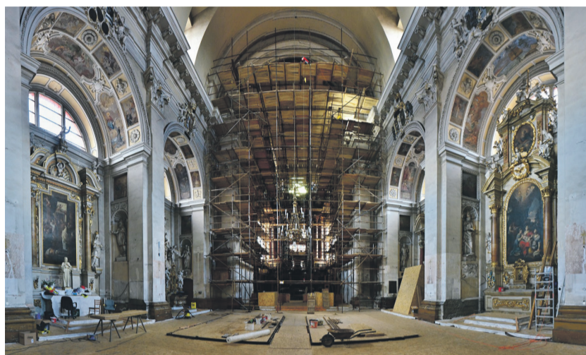
Kostel Nanebevzetí Panny Marie ve Staré Boleslavi v průběhu rekonstrukce na podzim 2018, foto: Robert Pecha

dané výdaje ve výši 118 milionů Kč hraří Evropský fond pro regionální rozvoj. Peníze mají posloužit nejenom na opravu samotné baziliky, ale i na zlepšení jejího okolí a zázemí.