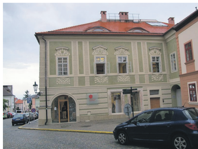
Dačického dům na Komenského náměstí v Kutné Hoře

Dačického dům, nacházející se v samotném historickém jádru Kutné Hory, je měšťanský dům z první poloviny 15. století. V roce 1555 se zde narodil nejslavnější představitel rodu Dačických z Heslova Mikuláš, který ucelil velmi významnou a faktograficky věrohodnou kroniku, později pojmenovanou Paměti Mikuláše Dačického z Heslova.