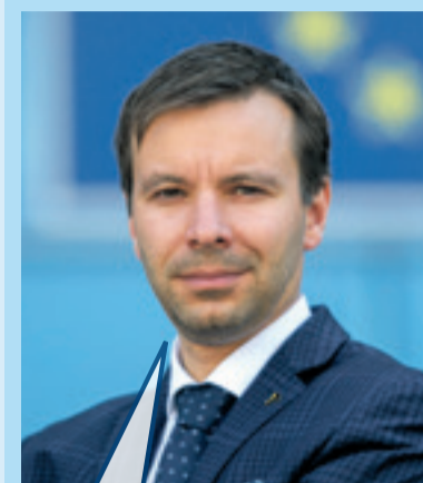
Marcel Kolaja místopředseda EP

zvalo členské země EU, aby zajistily svým zdravotnickým pracovníkům dostatek ochranných pomůcek, tedy respirátorů, brýlí, rukavic a plášťů. Vyčíslilo