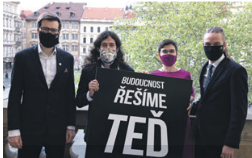
Jakub Michálek, Mikuláš Ferjenčík, Olga Richterová, Ivan Bartoš

Aktuálně nejdůležitějším tématem je otázka zdraví a celkové bezpečnosti našich občanů. Nicméně náš plán myslí na ty nejpotřebnější i stav ekonomiky. V potížích jsou i pracující na DPČ či DPP, lidé s handicapem, osoby bez zdatitelných příjmů a samozřejmě ti, kdo pečují o školou povinné děti, nemluvě o samozivitelích. A v neposlední řadě jsme mysleli i na modernizaci země, protože ta nikdy nepočká.