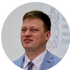
LUKÁŠ ČERNOŠSKÝ poslanec

Navržené změny by přispěly k náležitému plnění závazků vyplývajících z Úmluvy o ochraně architektonického dědictví Evropy a dalších mezinárodních úmluv týkajících se ochrany kulturního dědictví, ke kterým se Česká republika zavázala. Z těchto mezinárodních závazků vyplývá také jedna z dalších priorit Pirátů, kterou je účast spolků na ochraně památek. Je důležité hledat rovnováhu všech zájmových pohledů na problematiku státní památkové péče, která se musí stát přehledná, srozumitelná a předvídatelná.