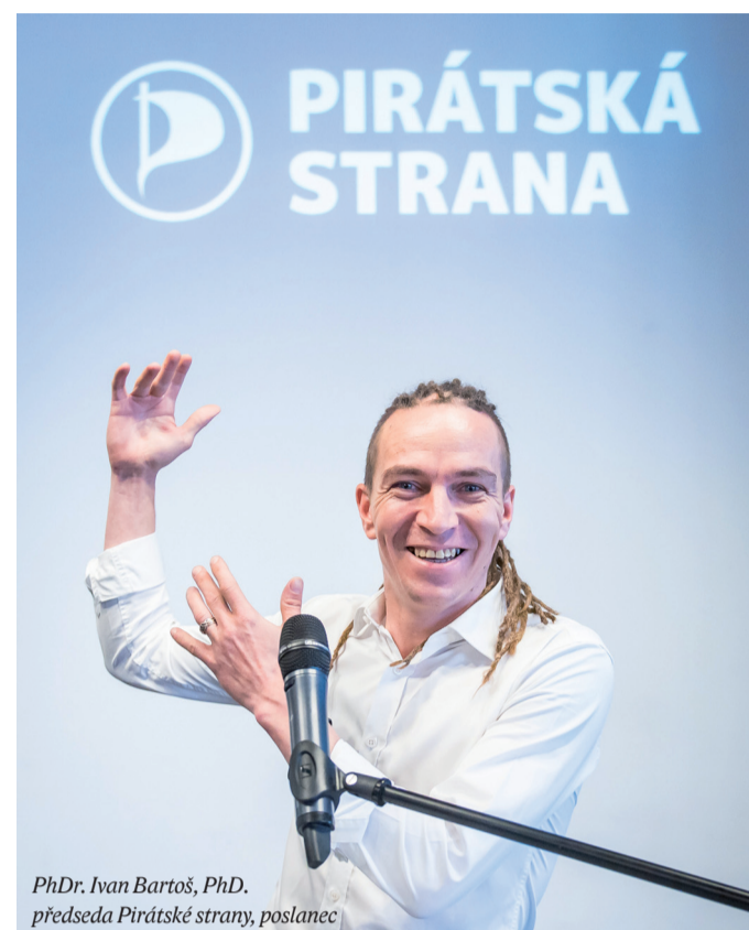
PhDr. Ivan Bartoš, Ph.D. předseda Pirátské strany, poslanec

Naší ambicí je po podzimních volbách mít v horní komoře alespoň pět zástupců, abychom mohli sestavit vlastní senátní klub. I díky spolupráci jeho členů budeme moci dál pokračovat v cestě, kterou jsme započali před jedenácti lety a na níž krůček po krůčku děláme naši zemi o něco lepším místem k životu. Bez imperátorů či jiných temných sil. Za tuto náročnou a mravenčí práci vám všem upřímně děkuji.