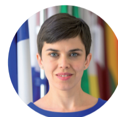
OLGA RICHTEROVÁ poslankyně

Stále ale hrozí exekuční pasti. Exekuční řád předložený Piráty a založený na principu „jeden dlužník – jeden exekutor“ vláda dosud nezměnila. Jenže právě náklady na komunikaci s několika exekutory u jednoho dlužníka a vysoké pokuty při proměškání lhůt zaměstnavatele odrazují od přijímání pracovníků v exekucích. Povede-li se nám dostat alespoň část z více než osmi set tisíc lidí v exekucích z šedé ekonomiky, přinese to státu jen na odvodech zhruba 20 miliard korun ročně.