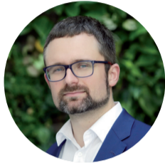
MIKULÁŠ PEKSA europoslanec

Česko je tradiční průmyslový stát a plánovaná modernizace pro něj představuje obrovskou příležitost. Poptávka po ekologičtějších řešeních vytváří zakázky pro automobilový a strojírenský průmysl. Budování chytrých sítí zase znamená nové příležitosti pro český IT sektor. Máme neopakovatelnou šanci získat na bouřlivě se rozvíjícím trhu silné postavení. Musíme ale být šikovni a rychlí. Odložme představy, že jediná pořádná továrna je taková, která hodně čadí.