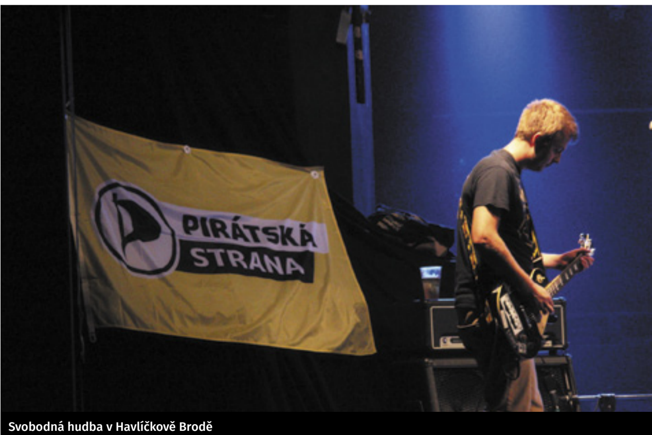
Svobodná hudba v Havlíčkově Brodě