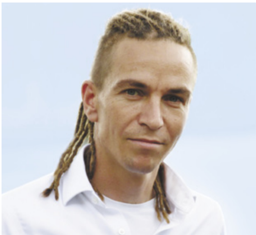
PhDr. Ivan Bartoš, Ph.D., předseda Pirátské strany