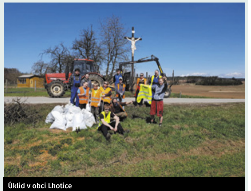
Úklid v obci Lhotice

V ážně. I ten nejmenší Pirát už zjistil, že odpady smrdí a špatně se v nich pluje. Proto se Piráti po celé Vysočině připojili k dalším dobrovolnickým posádkám projektu Uklidme svět, uklidme Česko 2018. Nalodili i své příznivce a další suchozemce a společně vypluli zatočit s černými skládkami a nepořádkem všeho druhu.